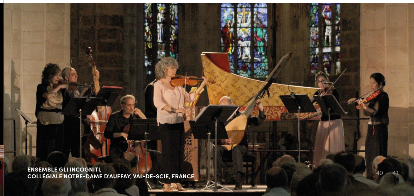
ENSEMBLE GLI INCOGNITI, COLLÉGIALE NOTRE-DAME D'AUFFAY, VAL-DE-SCIE, FRANCE

24 communes de la Seine-Maritime et de l'Eure