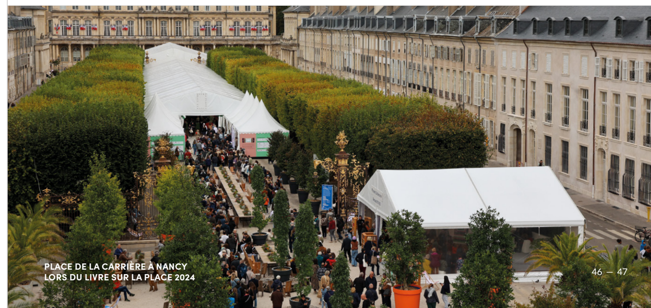
PLACE DE LA CARRIÈRE À NANCY LORS DU LIVRE SUR LA PLACE 2024